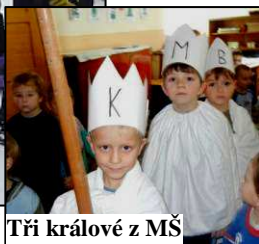
Tři králové z MŠ