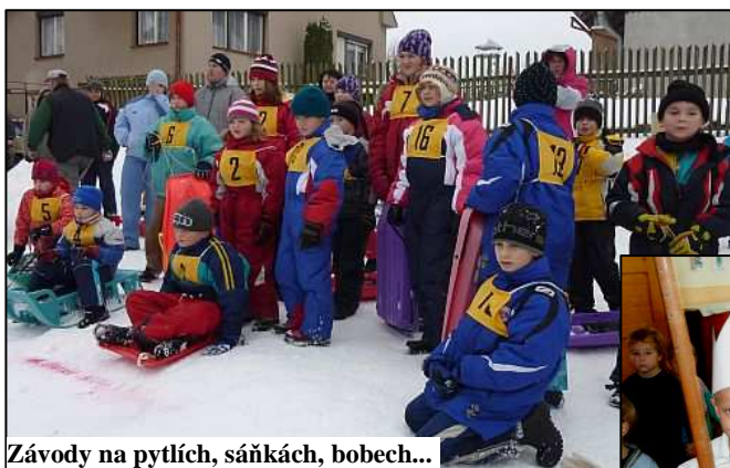
Závody na pytlích, sáňkách, bobech...