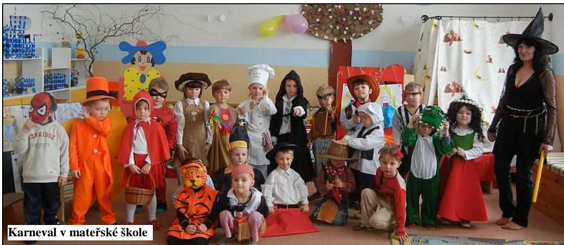
Karneval v mateřské škole