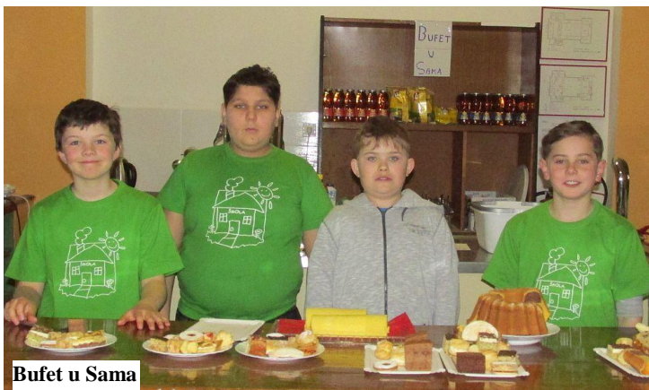
Bufet u Sama