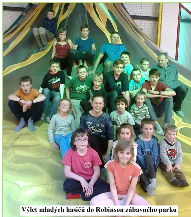
Výlet mladých hasičů do Robinson zábavného parku

OBEC OUDOLEŇ A ZÁKLADNÍ ŠKOLA A MATEŘSKÁ ŠKOLA VÁS ZVOU NA