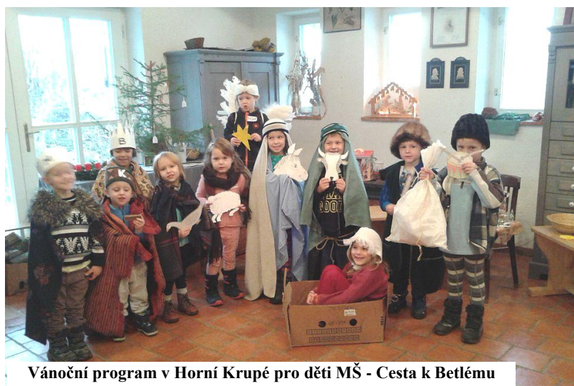
Vánoční program v Horní Krupé pro děti MŠ - Cesta k Betlému