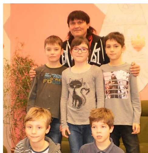
Zástupci ZŠ na Přeboru škol v šachu