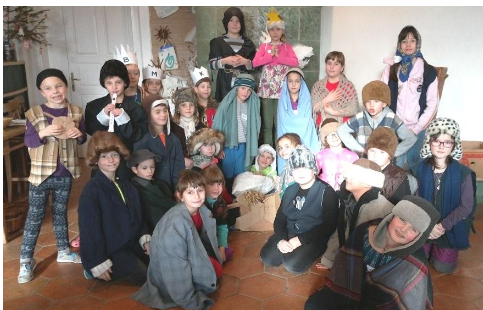
Vánoční program v Horní Krupé pro žáky ZŠ - živý betlém