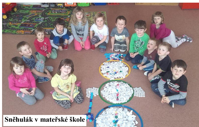
Sněhulák v mateřské škole