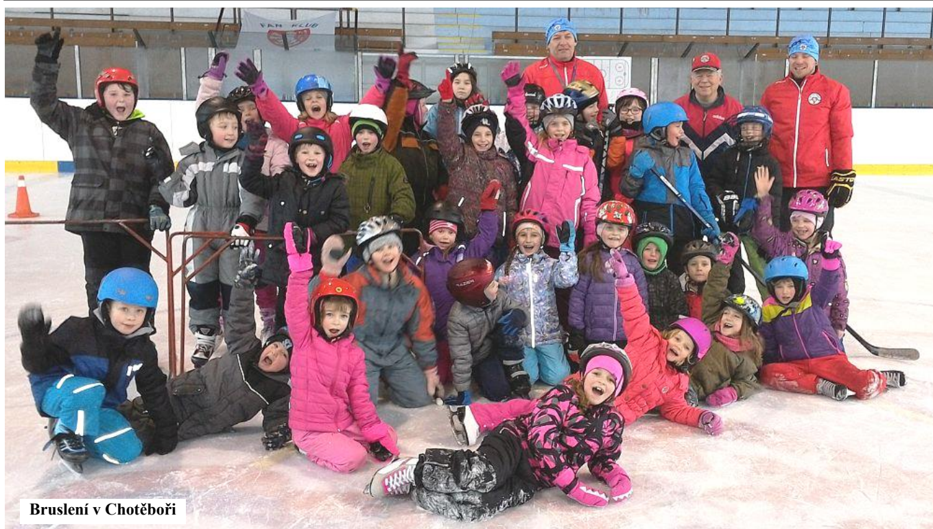
Bruslení v Chotěboři