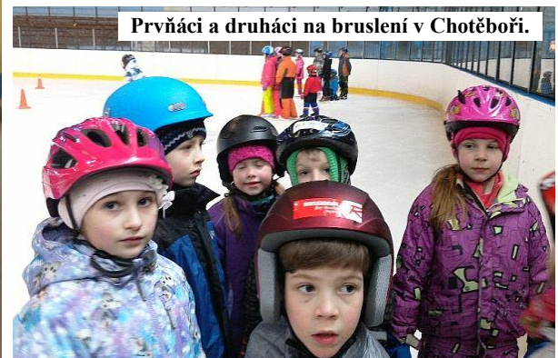
Prvníci a druháci na bruslení v Chotěboři.