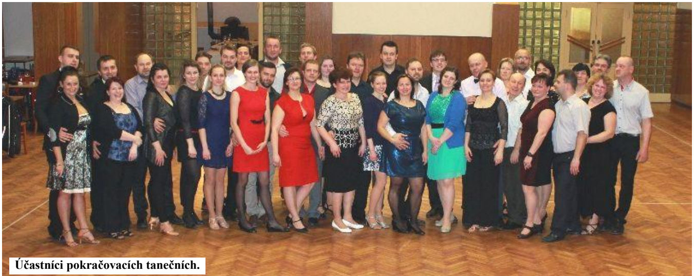
Účastníci pokračovacích tanečních.