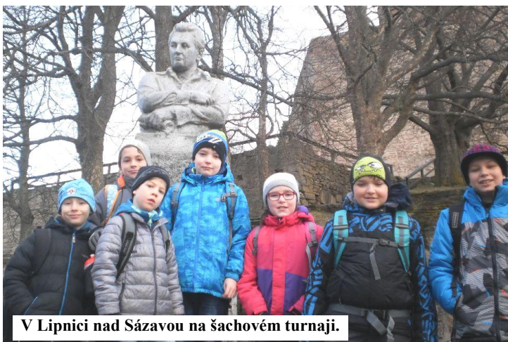
V Lipnici nad Sázavou na šachovém turnaji.