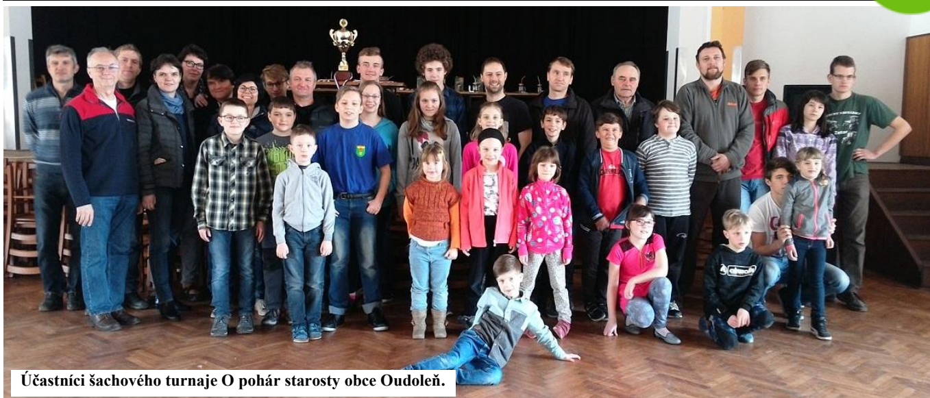
Účastníci šachového turnaje O pohár starosty obce Oudoleň.