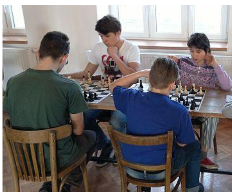
Šachový turnaj v Oudoleni.