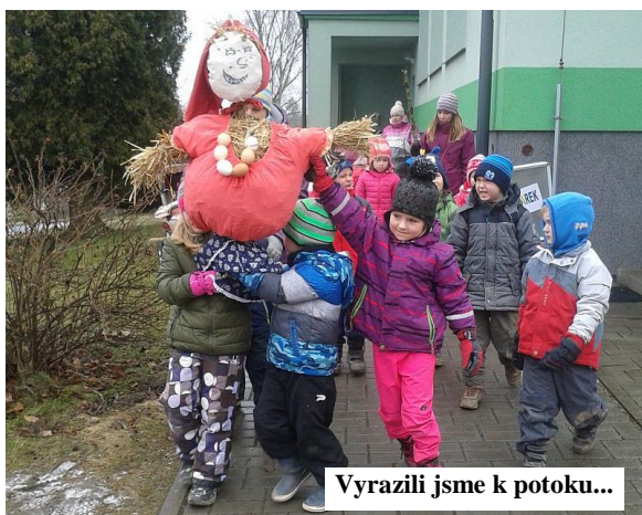
Vyrazili jsme k potoku...