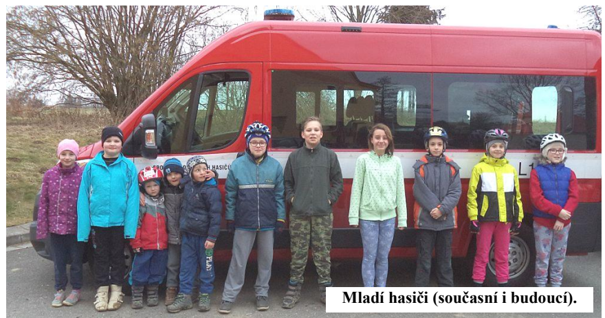
Mladí hasiči (současní i budoucí).