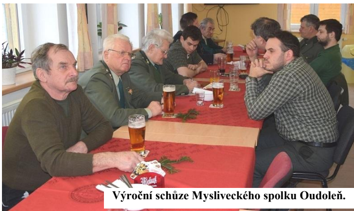
Výroční schůze Mysliveckého spolku Oudoleň.