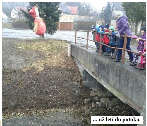
... už letí do potoka.