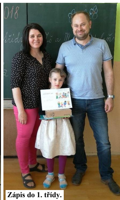
Zápis do 1. třídy.