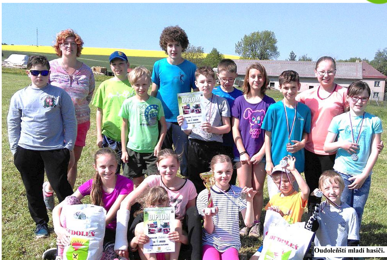
Oudoleňští mladí hasiči.