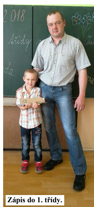
Zápis do 1. třídy.