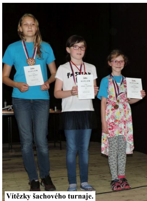
Vítězky šachového turnaje.