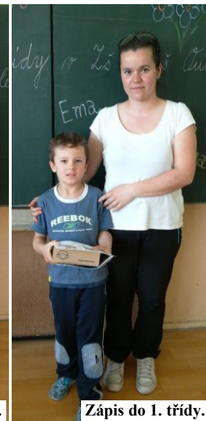
Zápis do 1. třídy.