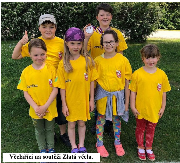
Včelařiči na soutěži Zlatá včela.