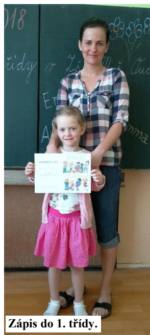
Zápis do 1. třídy.