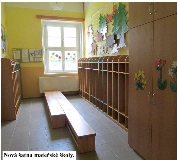
Nová šatna mateřské školy.