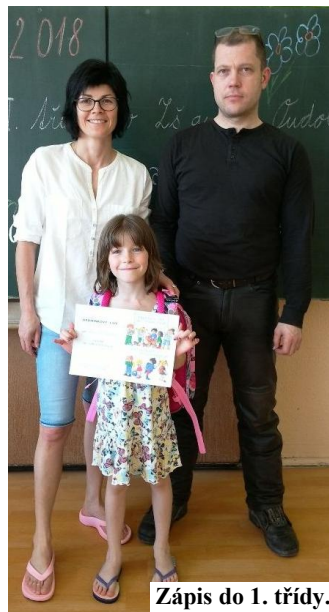
Zápis do 1. třídy.