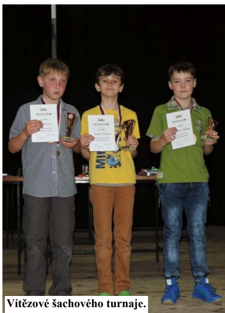
Vítězové šachového turnaje.