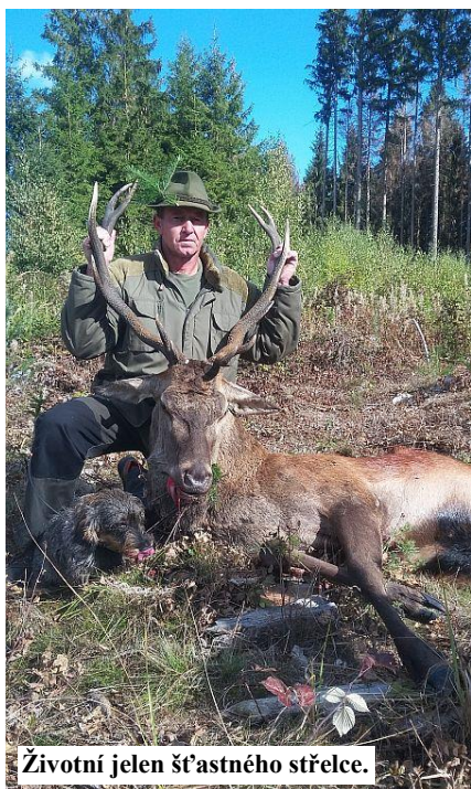
Životní jelen šťastného střelce.