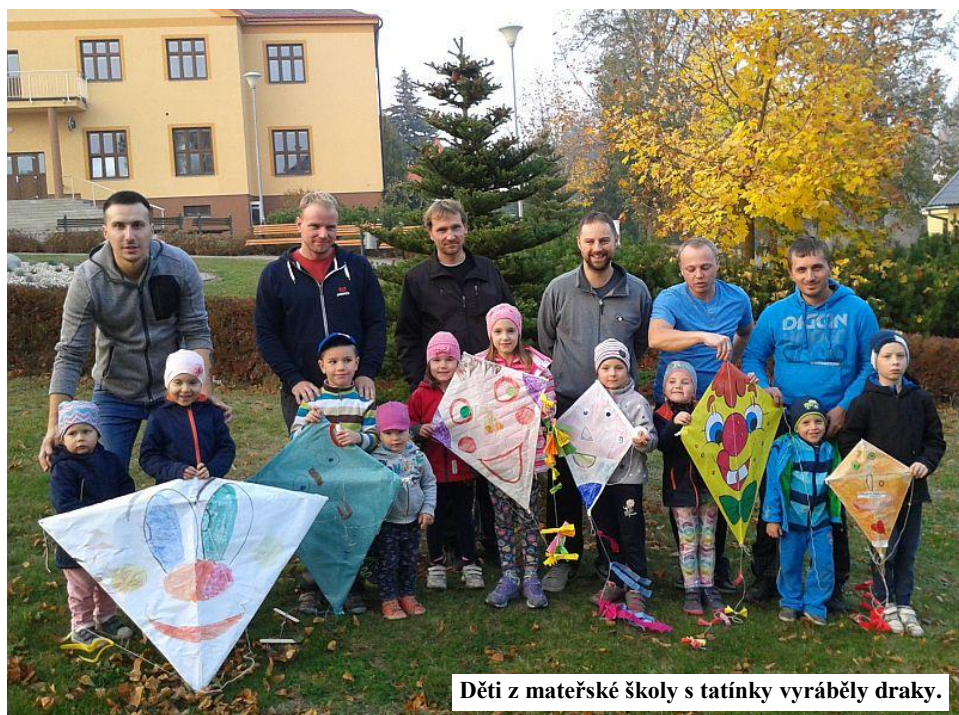
Děti z mateřské školy s tatínky vyráběly draky.