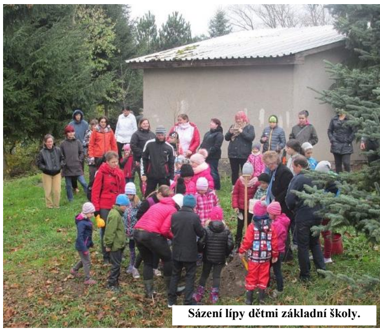
Sázení lípy dětmi základní školy.