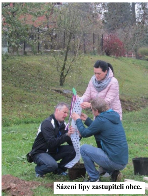
Sázení lípy zastupiteli obce.