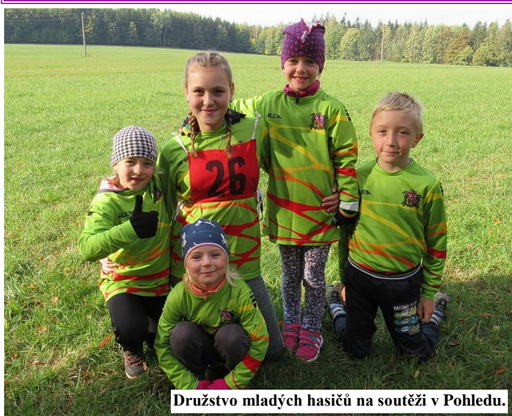
Družstvo mladých hasičů na soutěži v Pohledu.