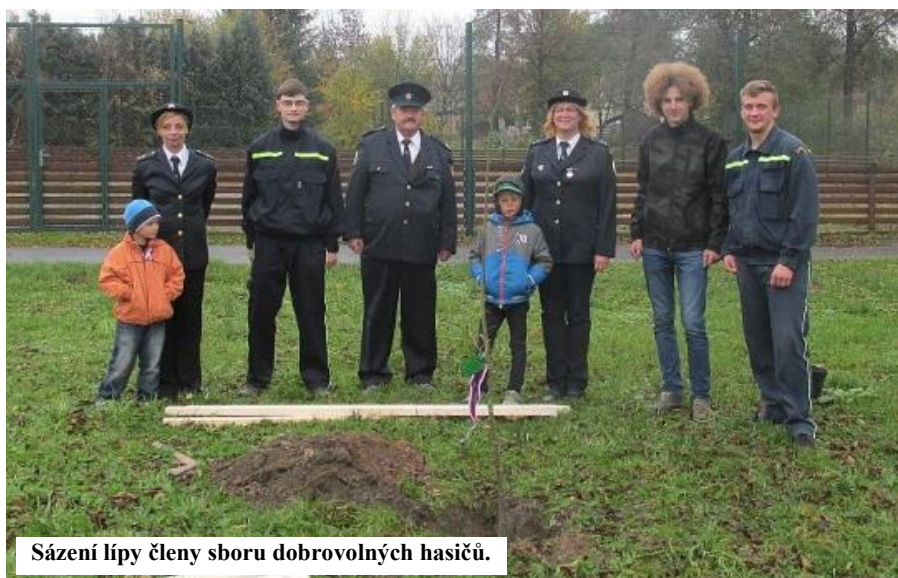
Sázení lípy členy sboru dobrovolných hasičů.