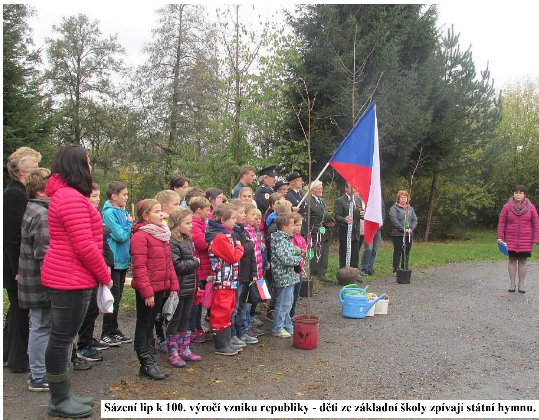
Sázení lip k 100. výročí vzniku republiky - děti ze základní školy zpívají státní hymnu.