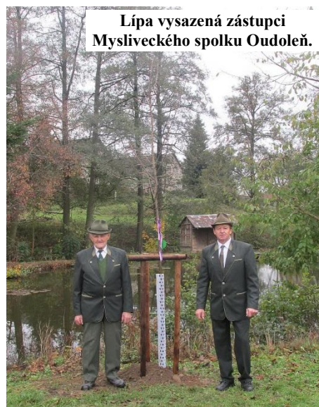
Lípa vysazená zástupci Mysliveckého spolku Oudoleň.