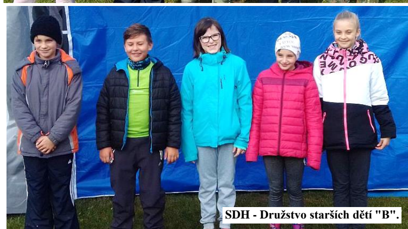
SDH - Družstvo starších dětí "B".