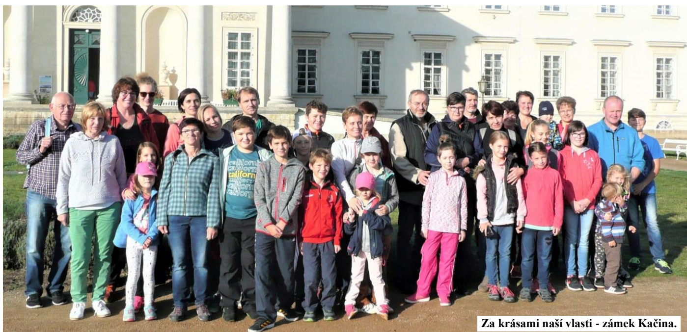
Za krásami naší vlasti - zámek Kačina.