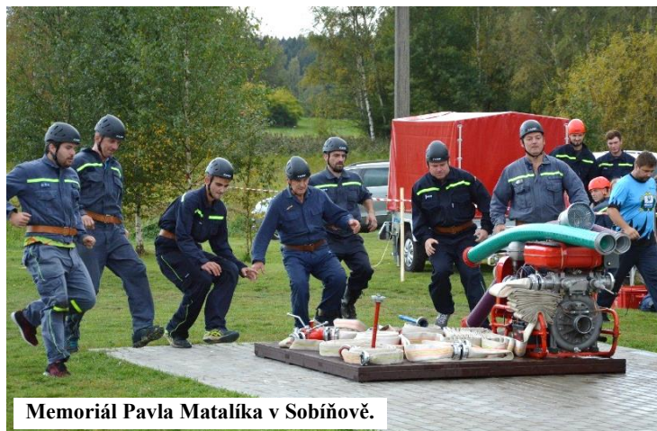
Memoriál Pavla Matalíka v Sobíňově.