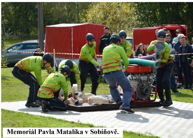
Memoriál Pavla Matalíka v Sobíňově.