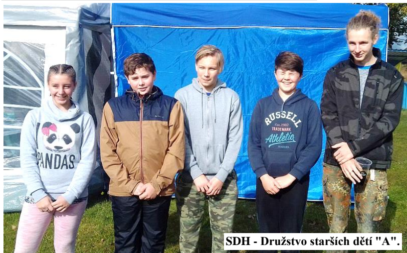
SDH - Družstvo starších dětí "A".

Máte zajímavou fotografii z naší obce nebo jejího okolí? Zašlete nám ji do naší soutěže.