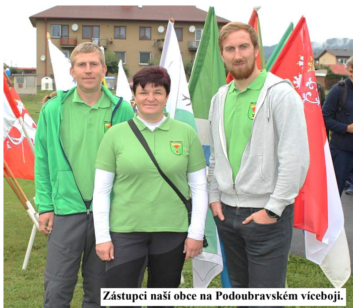
Zástupci naší obce na Podoubravském víceboji.

tel.: 776 85 25 03 (SMS, nebo volání, kdykoliv).