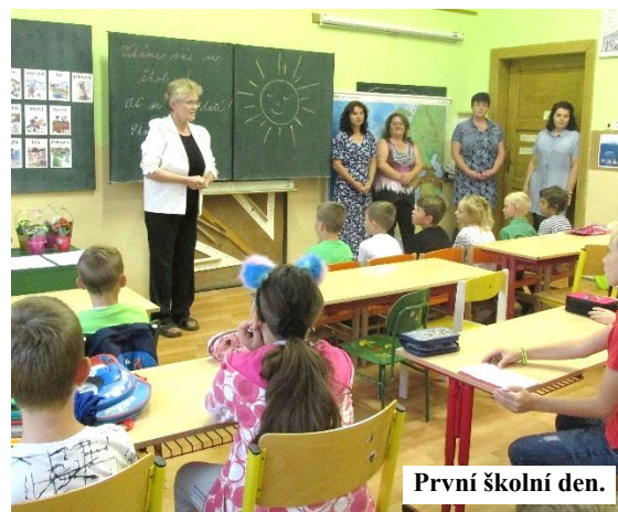
První školní den.