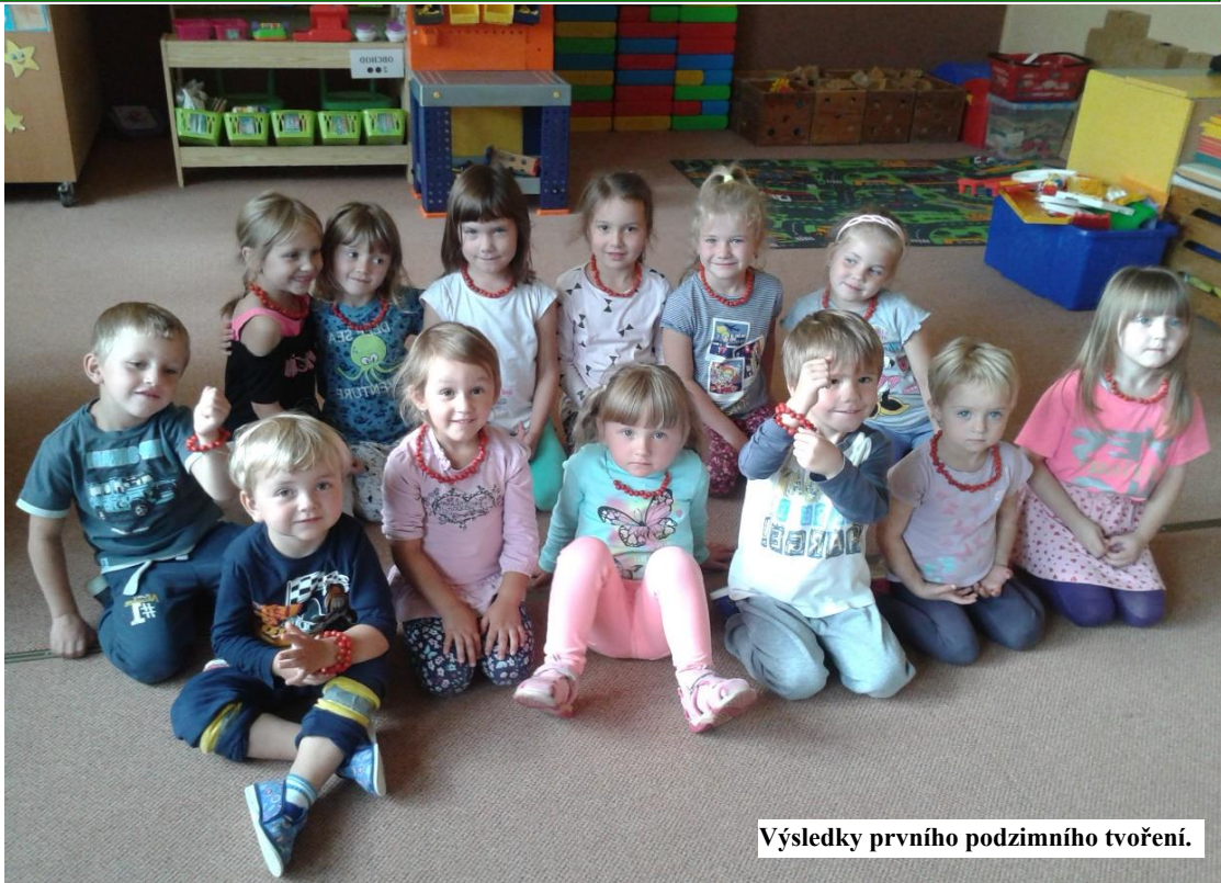
Výsledky prvního podzimního tvoření.

Prázdniny ufrnkly, přišlo babí léto a s ním nový školní rok i u nás ve školce. První týden v kolektivu bývá vždy náročný i pro zkušené školčáčky, natož pro nové děti, které ještě vůbec netuší, jak to ve školce chodí. Že to není jen přijít si pohrát s hračkami, ale zvykat si na nové prostředí, nové neznámé dospěláky, na pravidelný režim jiný než domácí, na spoustu hluku, velké množství dětí, každé něco jiného potřebuje, každé chce zrovna tu stejnou hračku, co mám já, a já zas chci tu, co má on... no prostě adaptační týden není žádná legrace. Moc záleží na dospělých, jak dítě