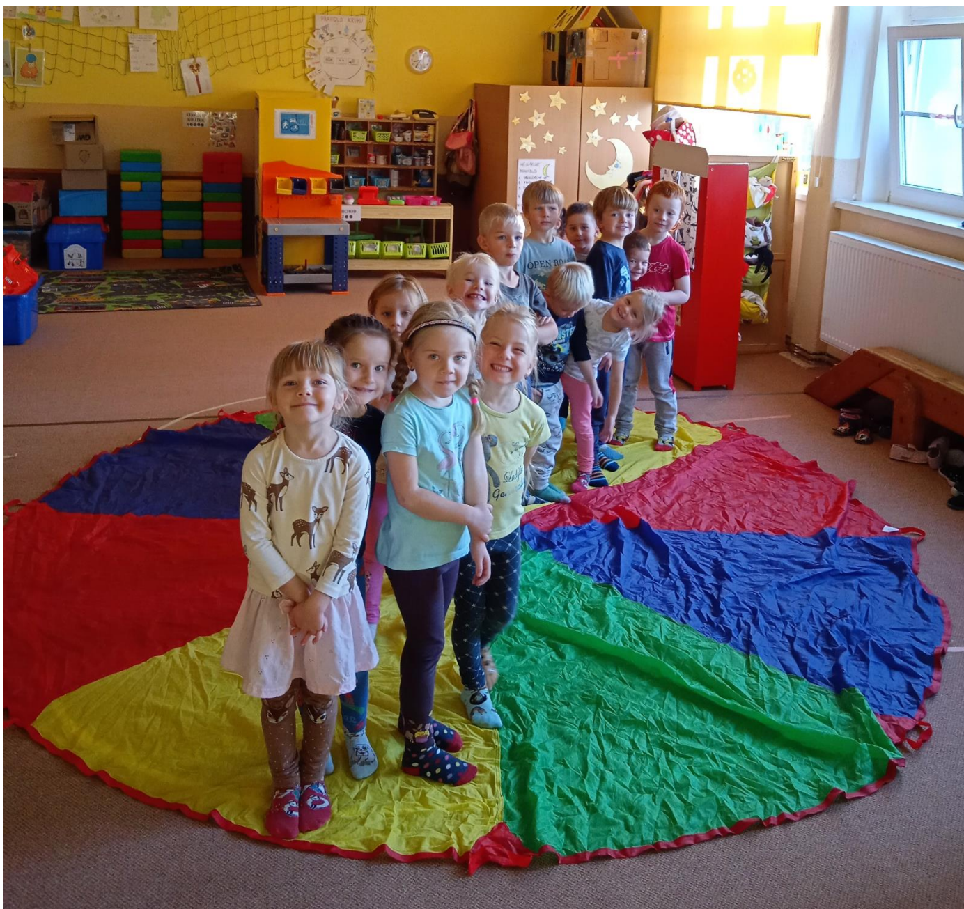
Děti z mateřské školy po cvičení s padákem.