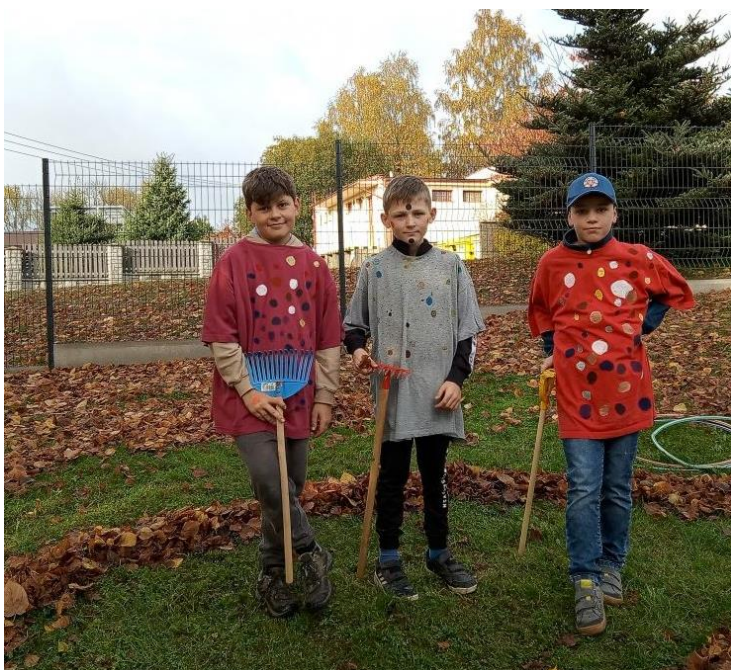
Puntíkový den v základní škole.

Zastávka „Slavětín, čekárna“ nebude po dobu trvání uzavírky obsluhována linkou 600320.