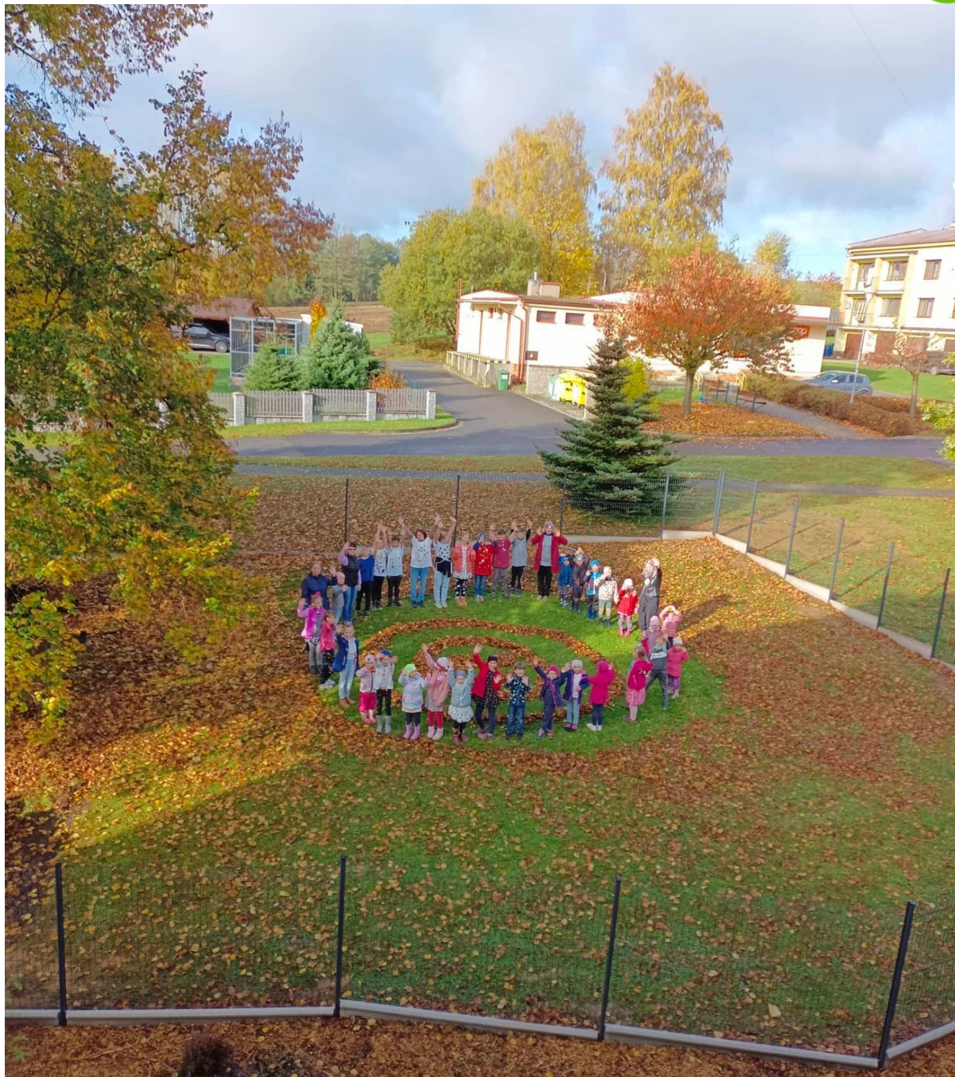
Puntikový den na nové školní zahradě.