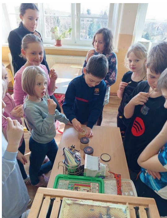
Ochutnávka medů.