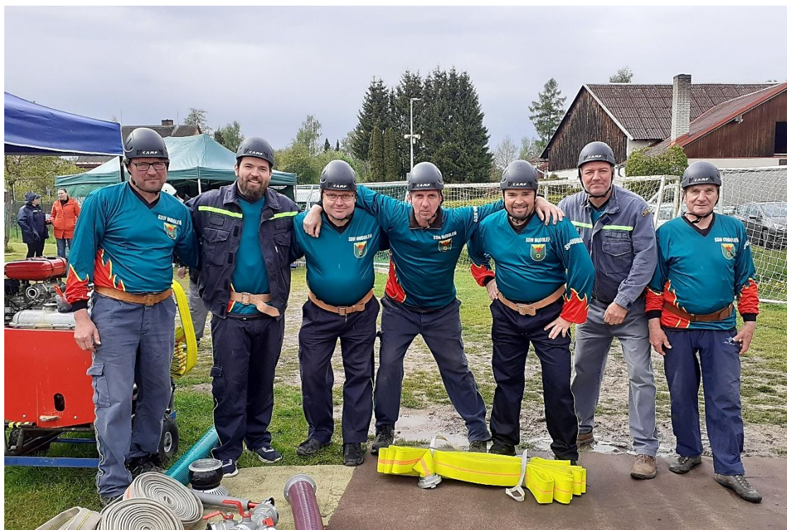
Soutěžní družstvo "Oudoleň B".

Následovaly jednotlivé útoky. A jako by bylo celé odpoledne začarované, snad nebyl jediný útok, který by proběhl bez potíží, a tak jsme mohli vidět od běžného: nezapojení nebo rozpojení hadice, „zapomenutí“ hadice, potíže s rozdělovačem, uklouznutí také neobvyklé situace jako nástřik proudnicí z polohy vleže nebo „uvaření“ stříkačky. Ale naštěstí se jinak nikomu nic nestalo, což se vzhledem k počasí a rozmoklému terénu jevílo skoro jako zázrak.