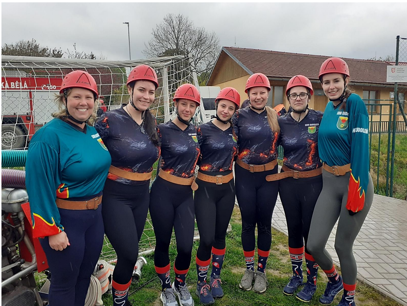
Naše družstvo žen, které získalo na okrskové hasičské soutěži v České Bělé pohár za 2. místo.