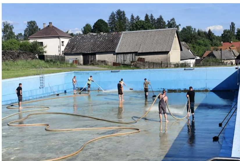
Hasiči vyčistili koupaliště.