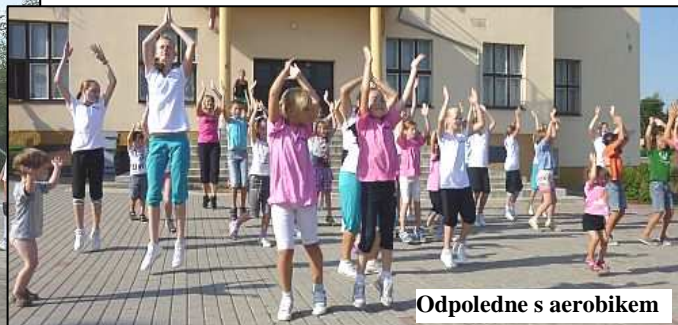
Odpoledne s aerobikem