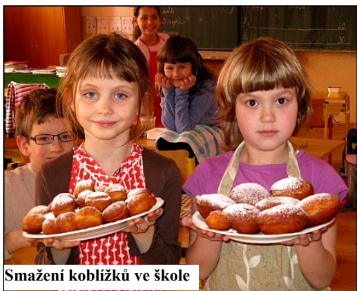
Smažení koblížků ve škole