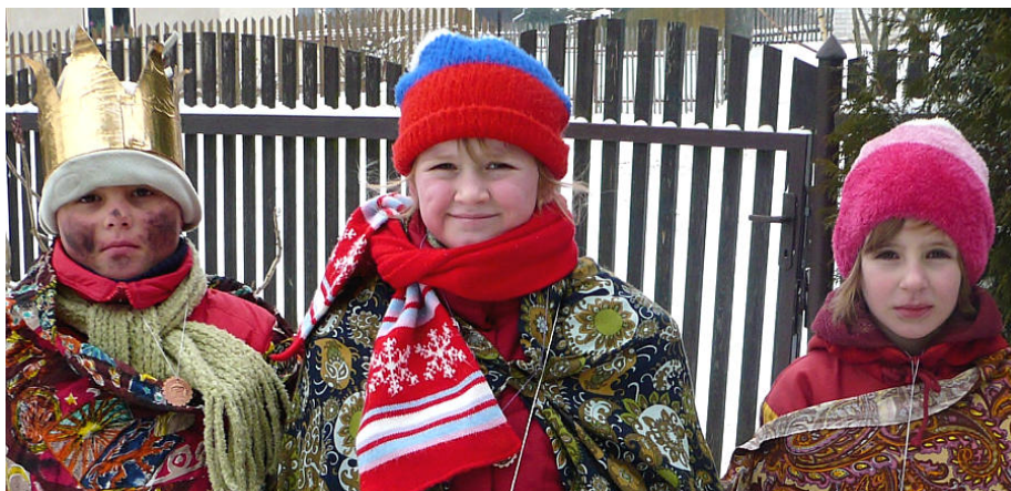
Pracovníci Oblastní charity Havlíčkův Brod.

Ještě jednou děkujeme za příspěvky a do nového roku 2008 přejeme vše dobré.